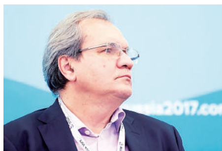
Валерий Фадеев рассказал гостям Сочи о роли «мягкой силы» в процессах мирного разрешения конфликтных ситуаций и сближения народов и государств